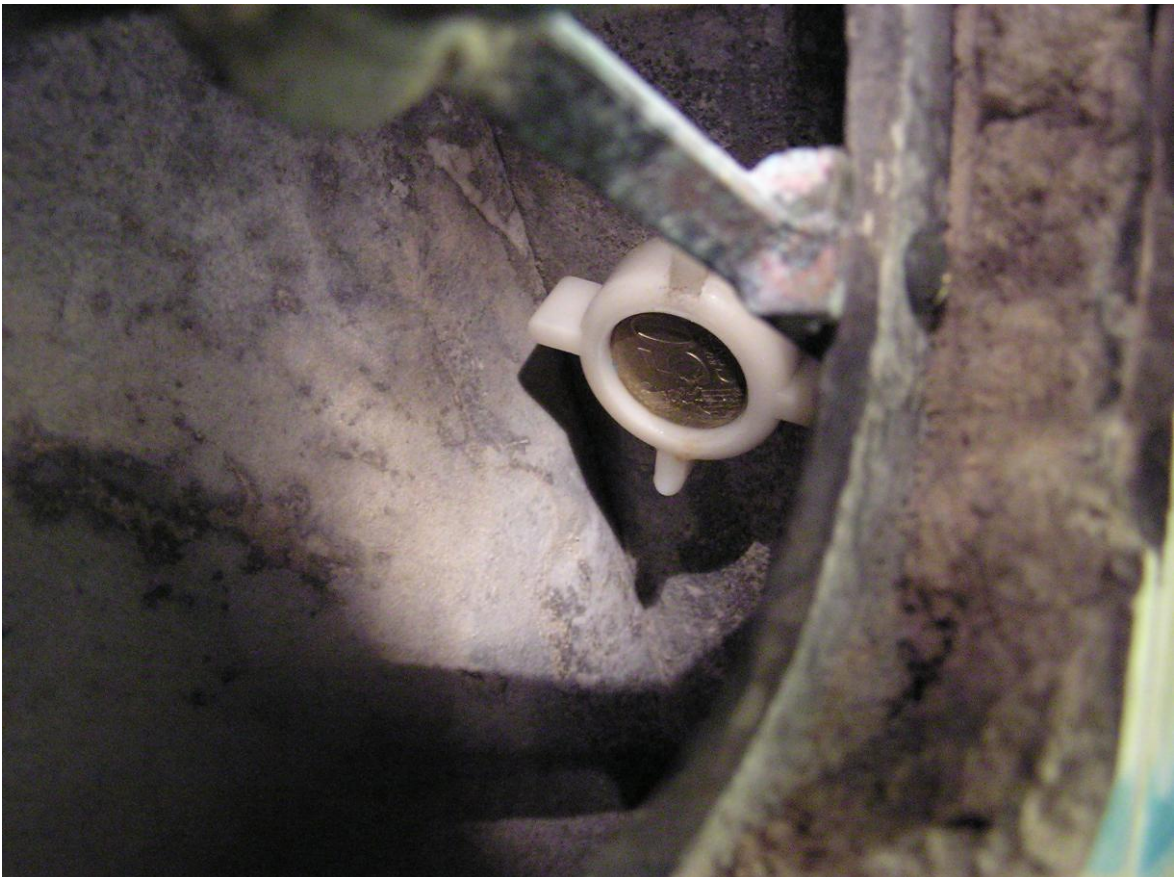
O tubo que devia estar bem tapado, mas não estava, e ia pingando...