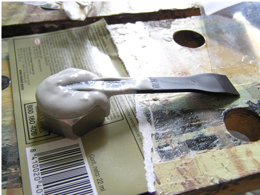
Aplicação da cola.