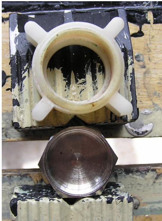
Rosca não standard, em cima. Tampa metálica que adaptei, em baixo.