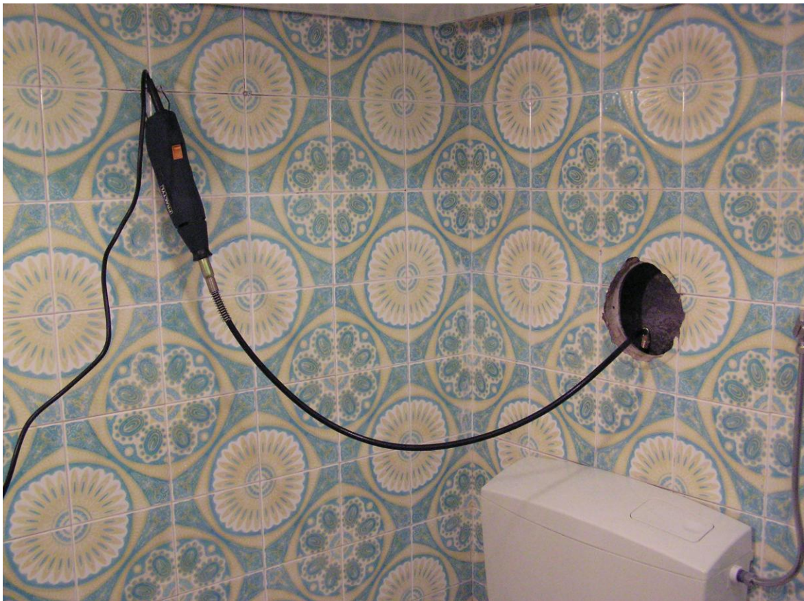
Material utilizado para desfazer a rosca do tubo.