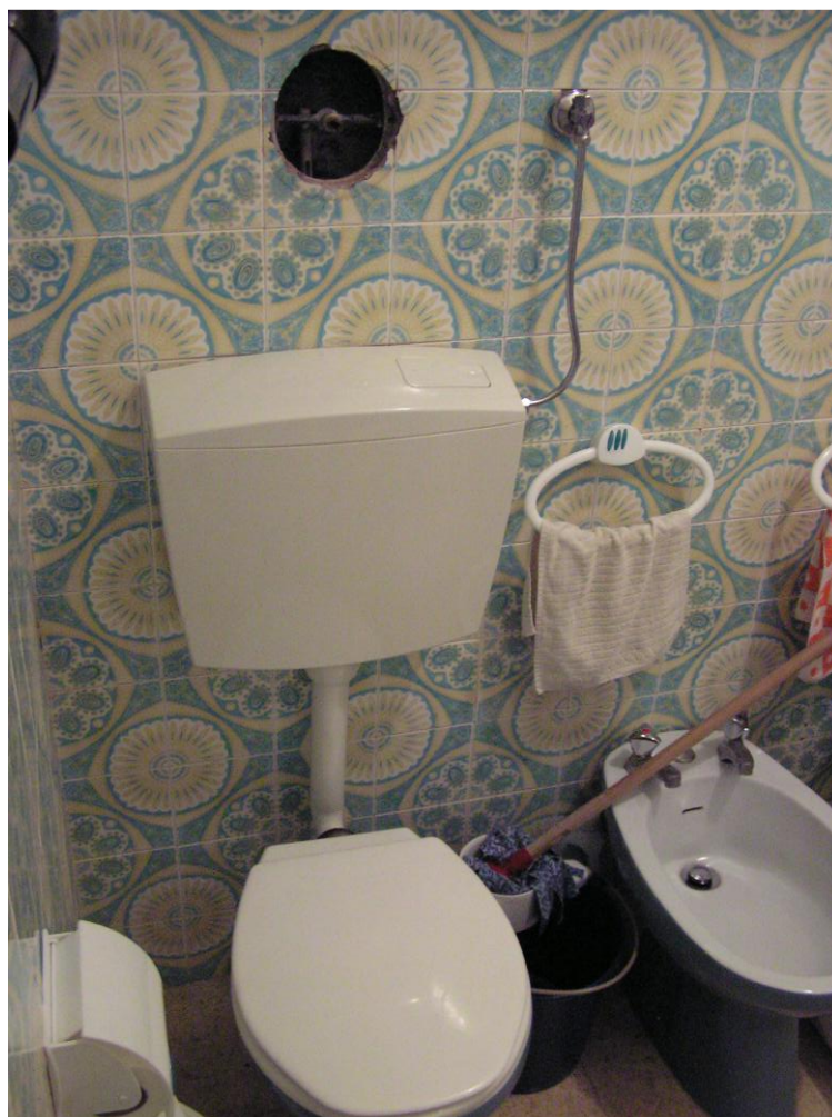
Sanita, autoclismo de parede (antigo, desactivado) e autoclismo novo, externo.