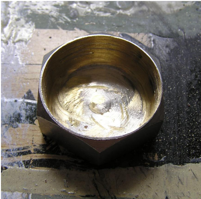
Tampa depois de devidamente torneada, e pronta a aplicar.