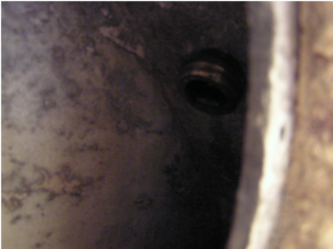
Tubo a torneiar, dentro da parede.