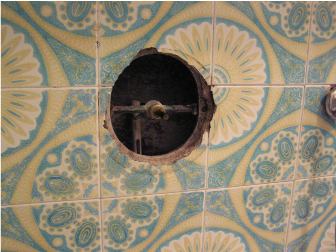
Autoclismo antigo, embutido na parede