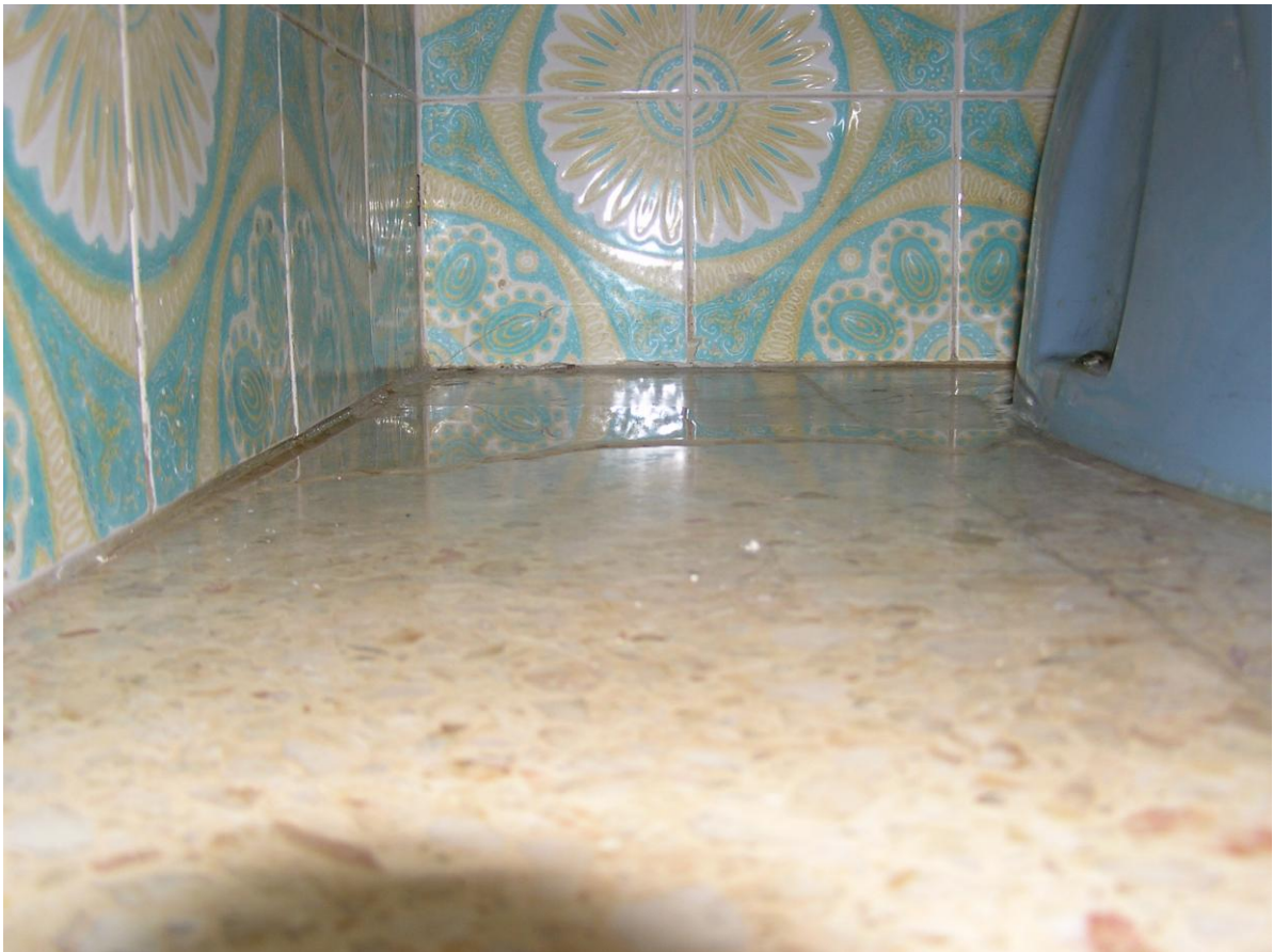
Resultado do pingo.