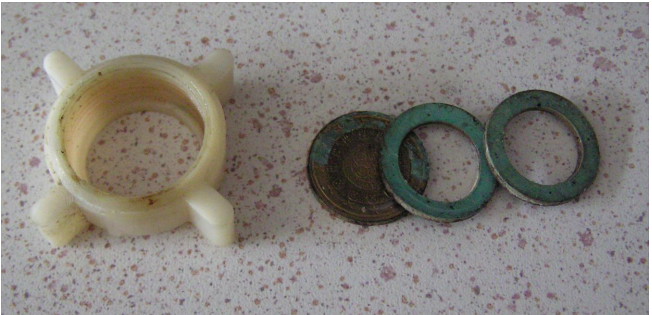
Os cinquenta “paus” e as duas anilhas podres que os canalizadores profissionais cá deixaram.